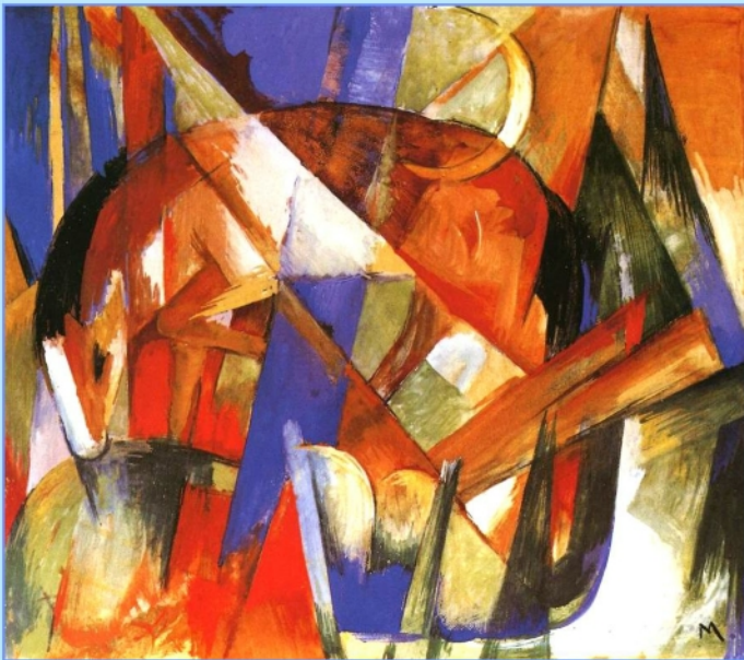
Frans Marc, Fantastisch beest Mars

Beeldende kunst kan natuurlijk ook gemêleerd zijn: er kunnen bij een kunstenaar bijvoorbeeld meerdere grondtonen, elementverdelingen en/of planetenkrachten werkzaam zijn, des te boeiender is het dat je dit in de horoscoop ook terugvindt! Door het kijken naar de kunst van vele moderne en klassieke kunstenaars komen we tot een belevingsastrologie.