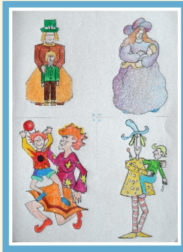
Moeder en kind vanuit de 4 elementen