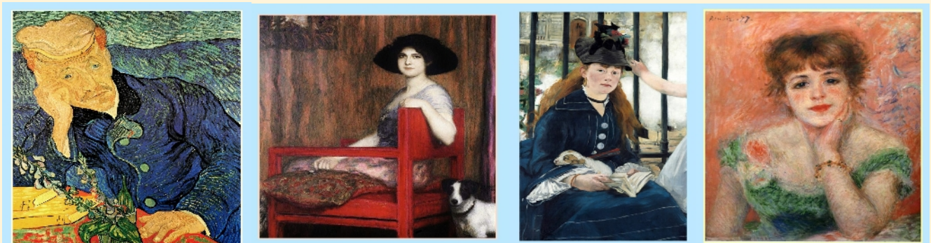
Vincent van Gogh, Dr. Gachet Ram

De Maanpositie heeft een sterke medebepalende uitdrukingskracht, bij de vrouw vaak net zo sterk als haar Zonneteken of dierenriemtekens.