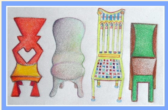
Stoelontwerp vanuit de 4 elementen