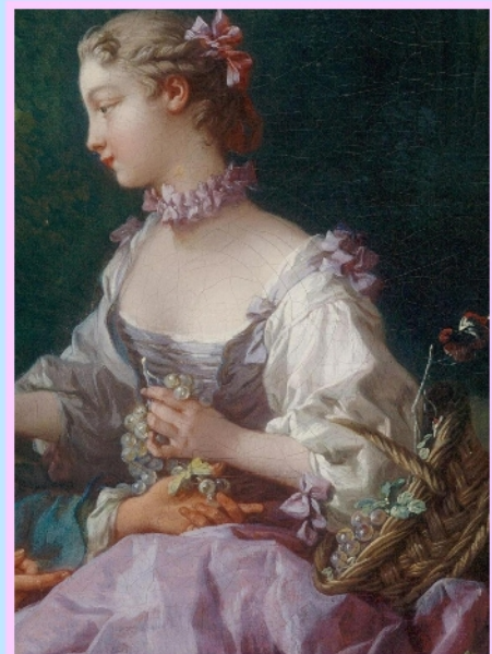
Francois Boucher Venus