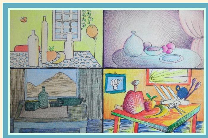
Stilleven vanuit de 4 elementen.