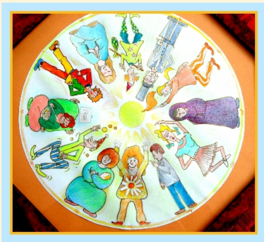
De 12 dierenriem tekens