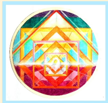
Het teken boogschutter